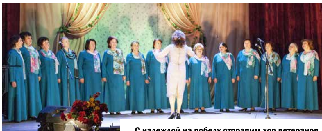
С надеждой на победу отправим хор ветеранов «Надежда» на областной фестиваль