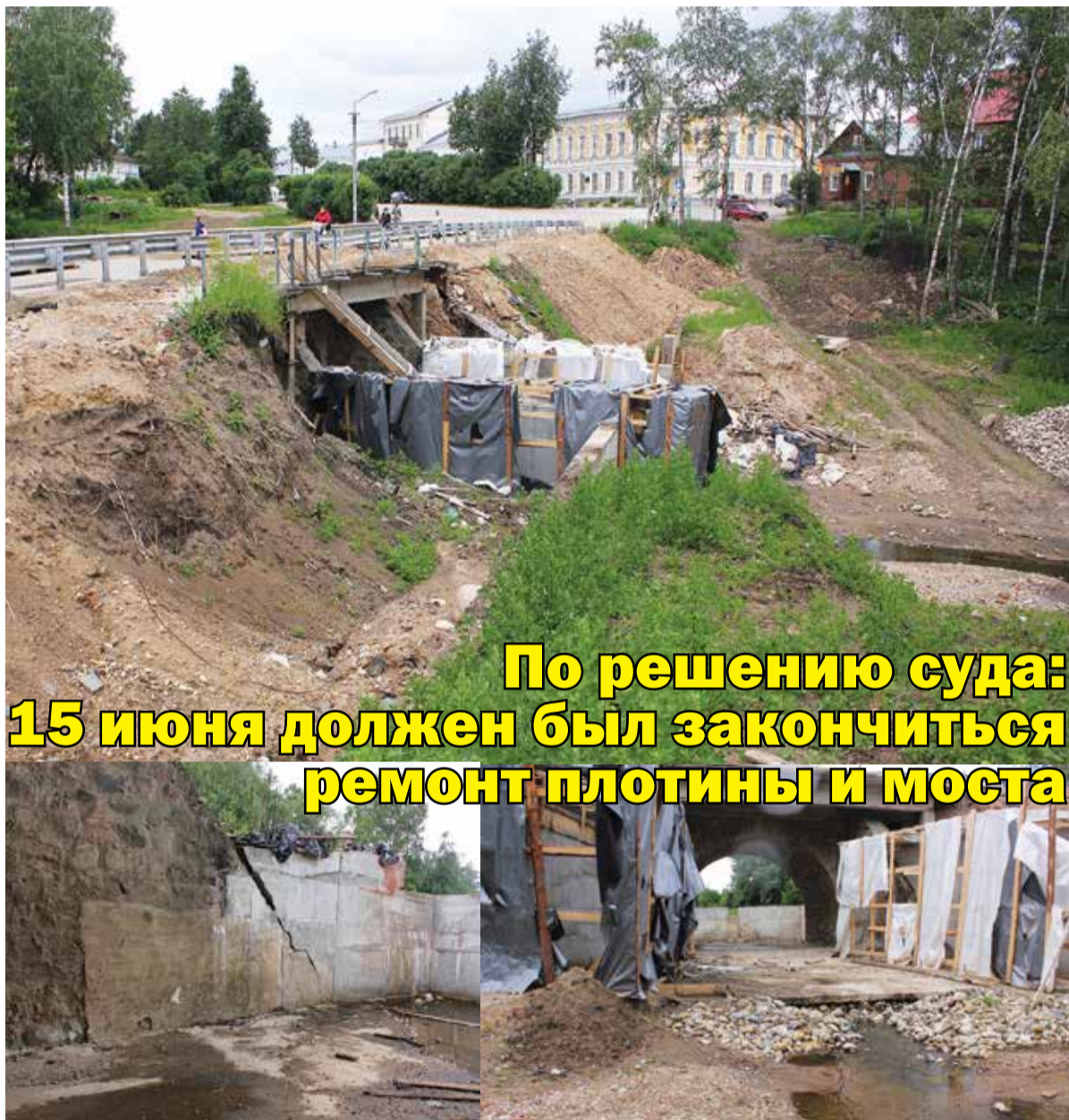
По решению суда: 15 июня должен был закончиться ремонт плотины и моста