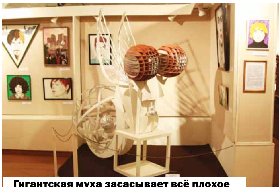
Гигантская муха засасывает всё плохое