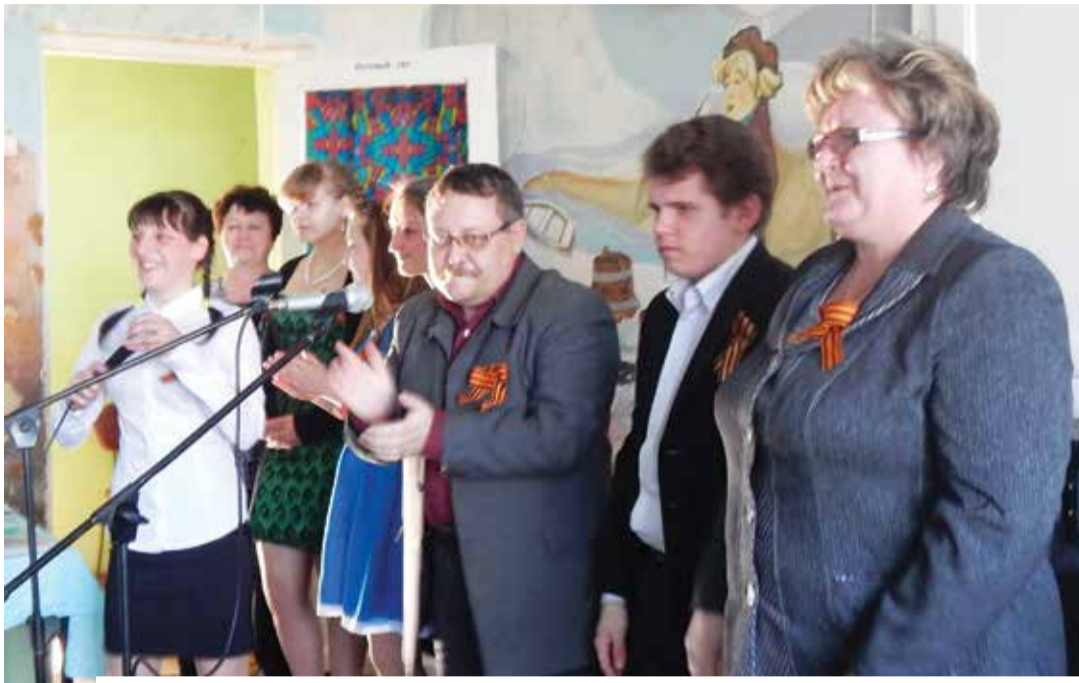
Творческий коллектив обучающихся и преподавателей Устюженского политехникума, вызвавшая множество эмоций у зрителей из Спасского