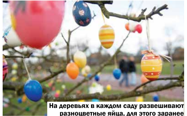
На деревьях в каждом саду развешивают разноцветные яйца, для этого заранее взрослые и дети украшают их вместе