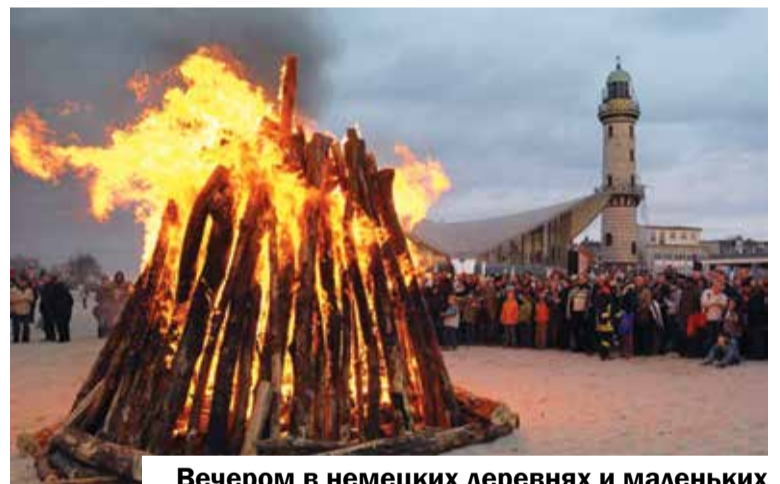
Вечером в немецких деревнях и маленьких городках все собираются вместе на площади и разжигают большой пасхальный костёр