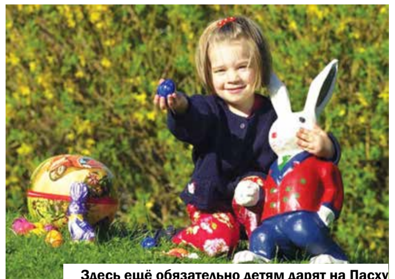
Здесь ещё обязательно детям дарят на Пасху подарки. Их прячут вместе с яйцами в саду, огороде или парке и дети идут их искать. И ещё верят, что зайчик им подарки принёс