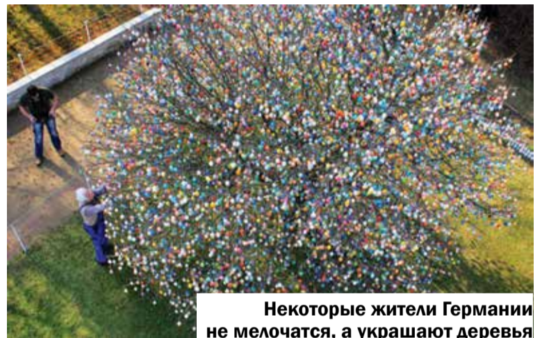
Некоторые жители Германии не мелочатся, а украшают деревья в саду по максимуму