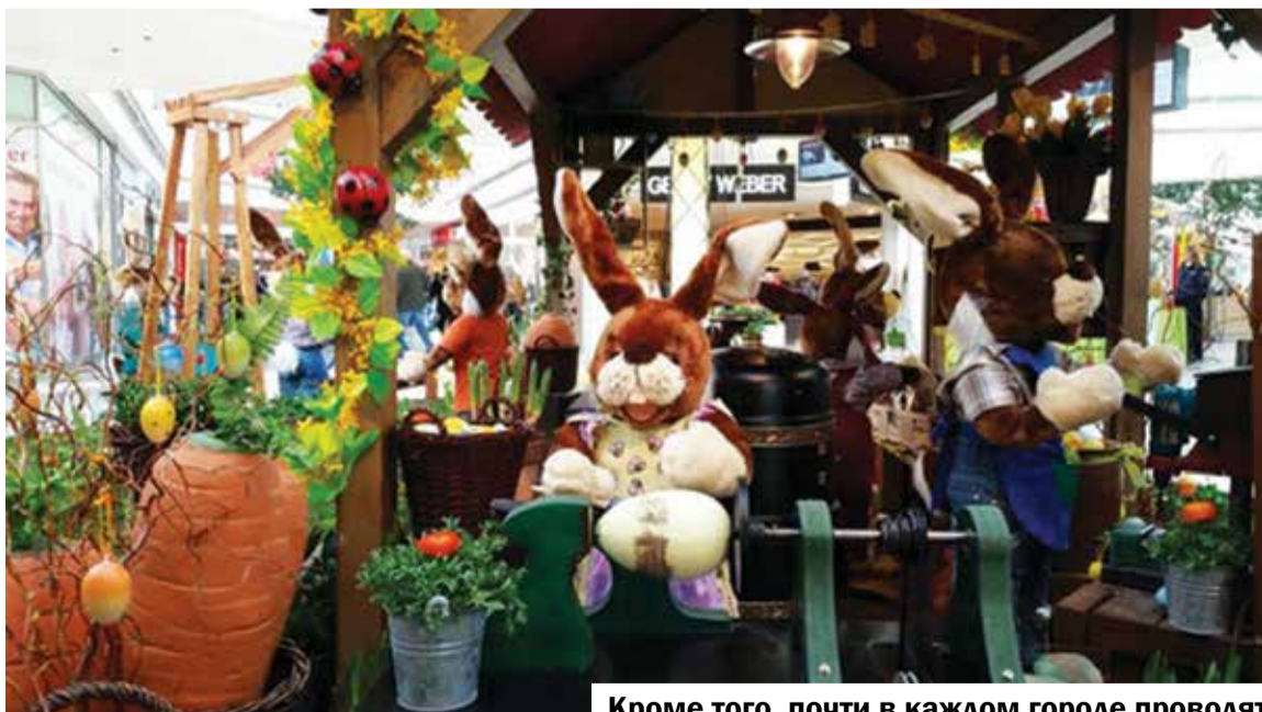
Кроме того, почти в каждом городе проводят пасхальные базары, на которых продают сделанные своими руками поделки