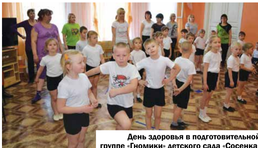
День здоровья в подготовительной группе «Гномики» детского сада «Сосенка»

После завтрака «гномики» отправились на праздник «Ключи здоровья», который проходил в главном здании детского сада. Здесь героиня праздника Чистюля проводила с детьми конкурсы, игры, танцы. Ребята с большим удовольствием выполняли