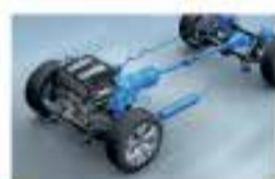
Пневматическая подвеска премиум-класса