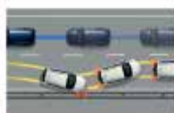
Система аварийного торможения