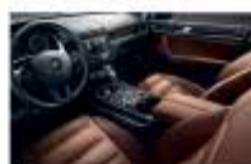
Натуральные материалы отделки

Некоторые из указанных в рекламе опций устанавливаются за дополнительную плату