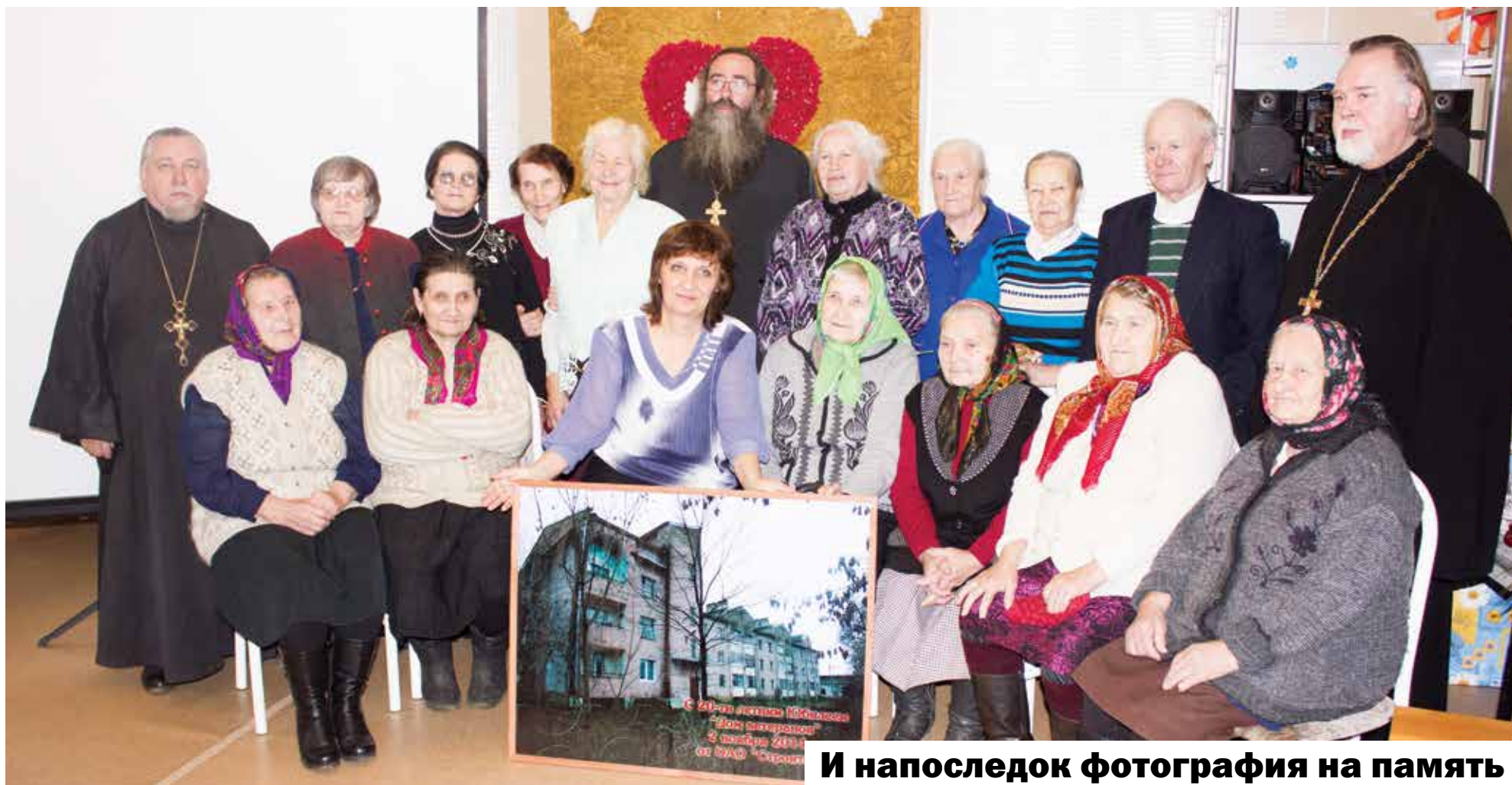
И напоследок фотография на память