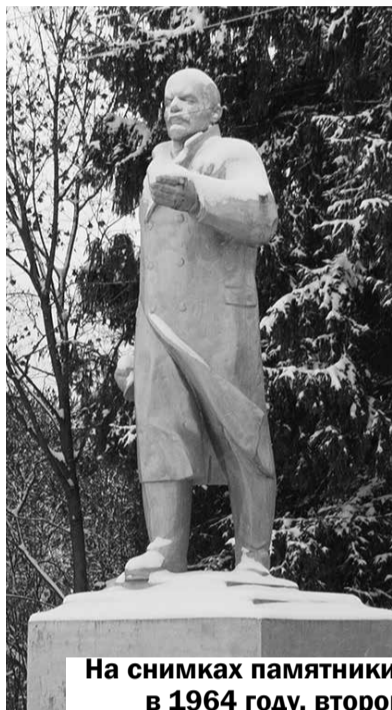
На снимках памятники Ленину в Устюжне: один был установлен в 1964 году, второй появился на этом же месте в 1998 году

Нам звонили даже из Череповца, чтобы мы вернулись к теме и всё-таки рассказали о памятнике Ильичу в Устюжне. Почему же на Торговой площади стоит памятник не 1964 года выпуска