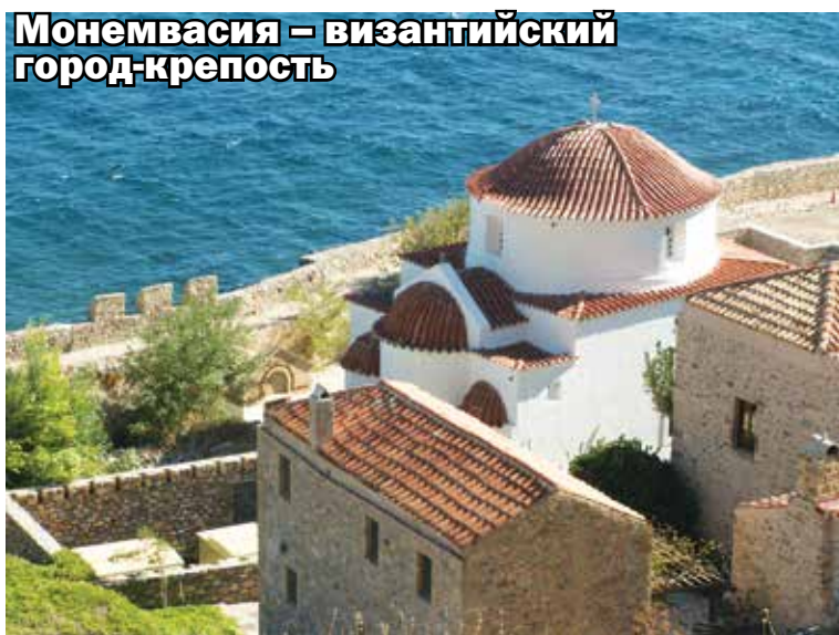
Монемвасия – византийский город-крепость