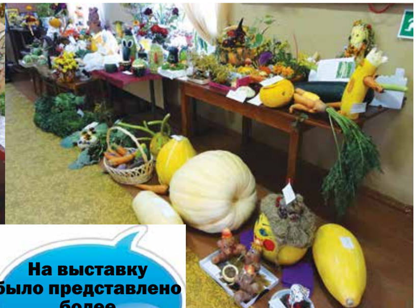
На выставку было представлено более 270 работ!