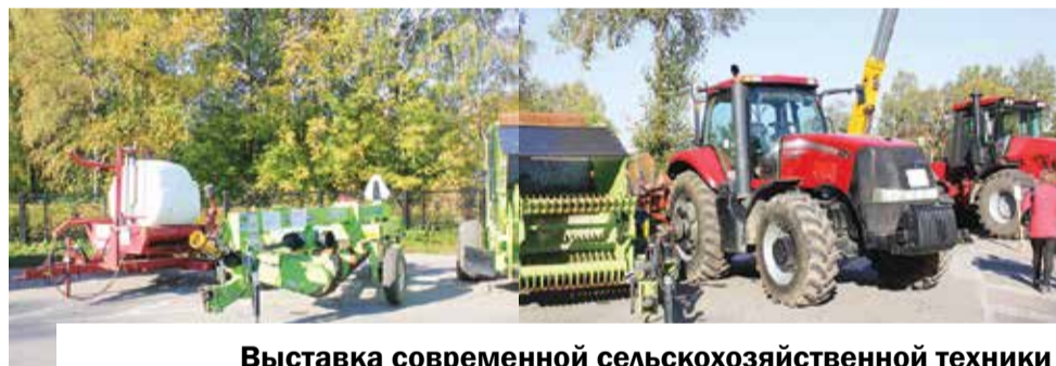
Выставка современной сельскохозяйственной техники на Соборной площади привлекала внимание детей и их родителей