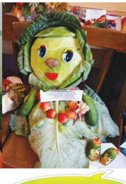
Старшая группа, д/с «Сосенка»