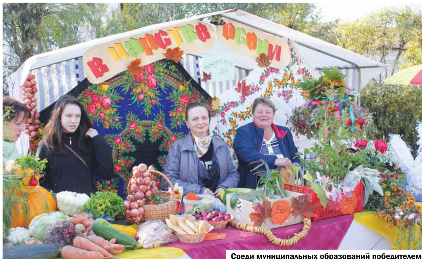
Среди муниципальных образований победителем в смотре-конкурсе стало МО Никольское