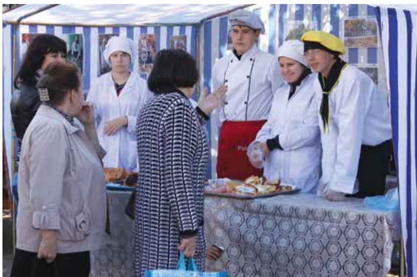
Студенты отделения «повар-кондитер» Устюженского политехникума дипломов или грамот не получили, но всю продукцию распродали на ура!