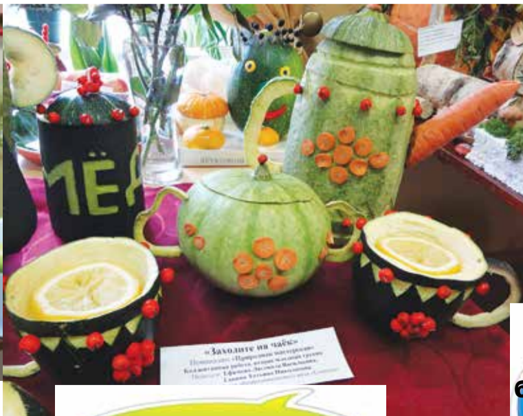
II младшая группа, д/с «Сосенка»