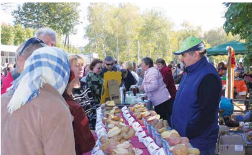
Устюжна – картофельная столица Вологодчины. Давно уже пора у нас проводить областной праздник картошки!