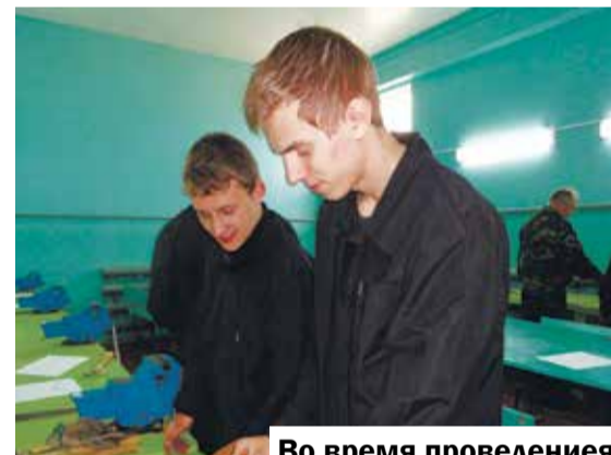
Во время проведения практических занятий

Во время таких мероприятий в техникуме выявляют студентов, имеющих повышенную мотивацию к учебной деятельности, которых впоследствии поддерживают. А привлечение к оценке умений и навыков внешних экспертов из числа социальных партнеров учебного заведения позволяет совершенствовать учебный процесс, ориентируясь на требования рынка труда и окружающей среды к выпускаемым специалистам.