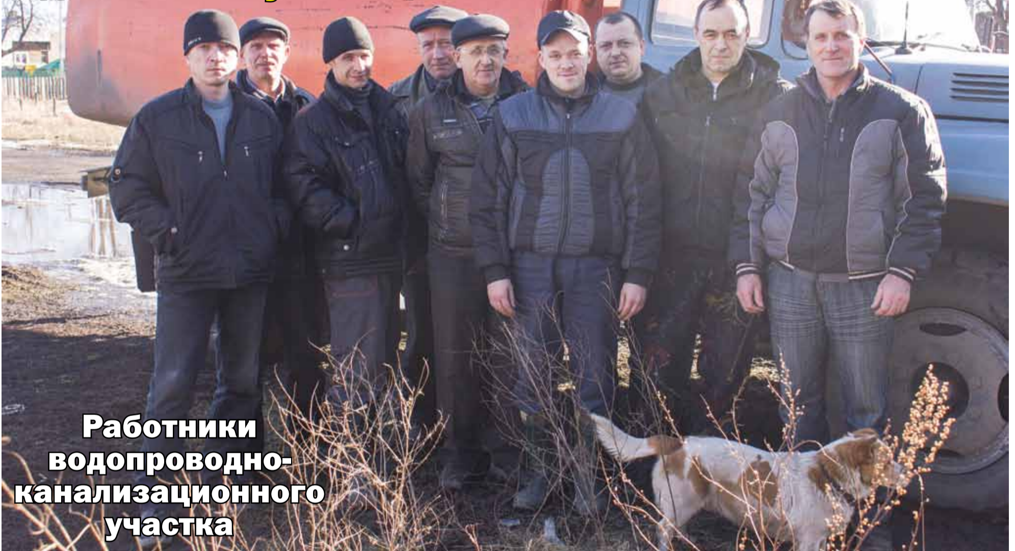
Работники водопроводно- канализационного участка

Вас редко хвалят – тружеников быта, Когда тепло, светло и есть вода... С днём коммунальщика!