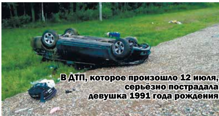
В ДТП, которое произошло 12 июля, серьезно пострадала девушка 1991 года рождения

– 16 июля в деревне Коново водитель автомобиля «ВАЗ-2104» из-за несоблюдения безопасной дистанции, совершил столкновение с «ВАЗ-2109».